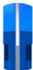
Etanchéité Métal / Métal